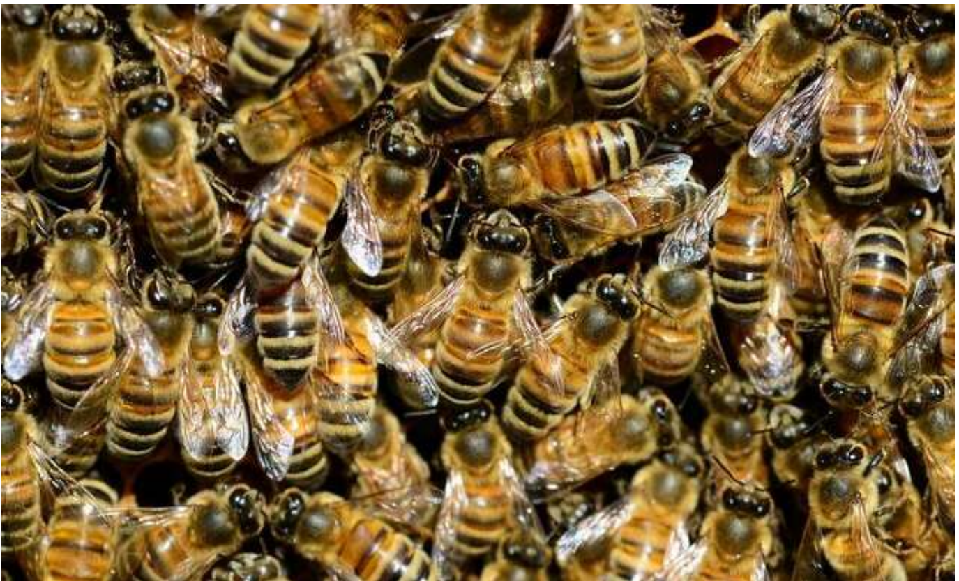
Schwarz und Gelb sind die neuen Farben im DC Tower. David Hofer

Eine bauliche Herausforderung waren dabei die Vorarbeiten zum Schutz der Stöcke aufgrund der teils heftigen Windentwicklungen rund um den DC Tower. Dank einer speziellen Konstruktion aus verzinktem Stahl konnte die optimale Lösung gefunden werden, um den Bienen ein angenehmes Ambiente zu schaffen. „Damit können wir verhindern, dass die Tiere in jeglicher Weise beeinträchtigt werden. Vielmehr tragen sie jetzt bestens geschützt für ein noch bunteres Leben rund um den Tower bei“, so David Friedl.